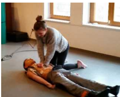
Erste Hilfe kann Leben retten! Schülerin beim Üben der Herzdruckmassage an einer Puppe

Seit 2005 werden am Uhland-Gymnasium Schüler*innen im Bereich Erste Hilfe ausgebildet.