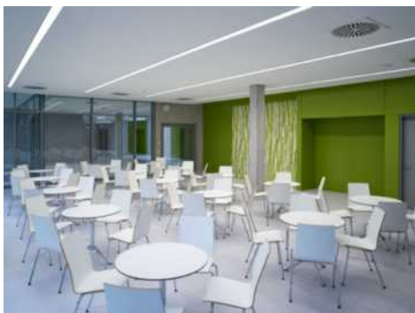
Die Cafeteria des Uhland-Gymnasiums bietet Platz zum Essen und Verweilen