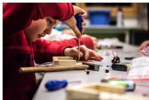
Ob spielen, tanzen, basteln – in unserem AG-Angebot findet jede*r etwas, das Spaß macht!

Alle Angebote sind kostenlos, inklusive des Hortes , und können nach dem Baukastenprinzip gewählt werden ( nicht tage- oder schienenweise, wie an den Grundschulen ). Genauere Informationen finden Sie im Bereich „GTS“ auf der Internetseite.