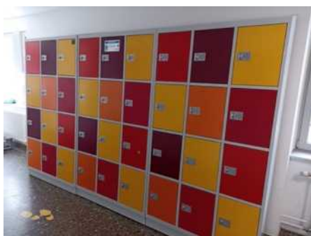
Schließfächer im Untergeschoss des Altbaus

Schließfächer im Untergeschoss des Altbaus sowie neben der Spielhalle im Erdgeschoss des Neubaus können über den Anbieter direkt gemietet werden. Die Anmeldung erfolgt über die Internetseite der Firma Astra . Nach der Anmeldung wird ein Schließfach-Code ausgestellt und zugesandt. Es kann gebucht werden, solange der Vorrat reicht.