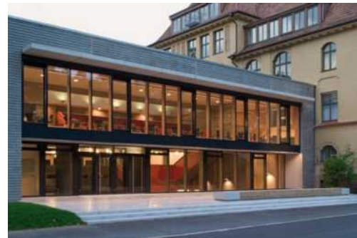
Die Mensa Uhlandstraße im Gebäude des Kepler-Gymnasiums

Nähere Informationen erhalten Sie auf unserer Internetseite .