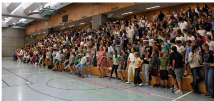
Jeder darf mitreden! Unsere Schulgemeinschaft bei der Schulversammlung im Schuljahr 2023/24

Darüber hinaus können sich die Schüler*innen in der Schüler*innen-mitverantwortung (SMV) oder im Schüler*innensanitätsdienst (siehe Informationen unter 3.4 und 3.5) einbringen.