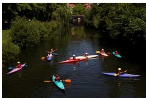
Schüler*innen beim Kajakfahren auf dem Neckar

Unser umfangreiches AG-Angebot richtet sich an alle Schüler*innen; wir freuen uns auf zahlreiche Anmeldungen!