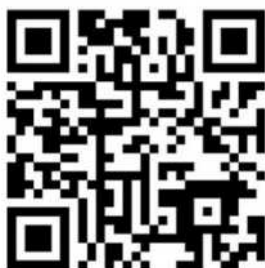
QR-Code zum Speiseplan der Mensa

Den Speiseplan können Sie über folgenden Link (klicken Sie auf „Mensa Tübingen Speisepläne“) oder QR-Code abrufen: