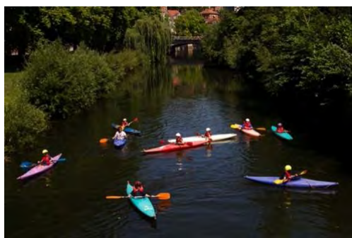
Schüler*innen beim Kajakfahren auf dem Neckar

Unser umfangreiches AG-Angebot richtet sich an alle Schüler*innen; wir freuen uns auf zahlreiche Anmeldungen!