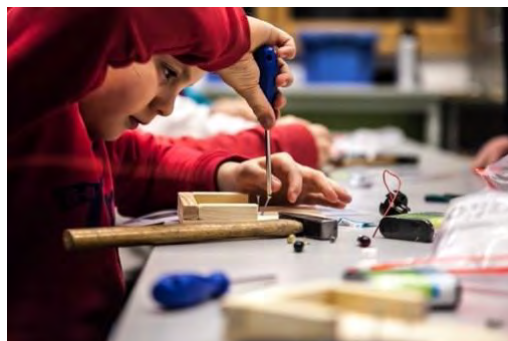
Ob spielen, tanzen, basteln – in unserem AG-Angebot findet jede*r etwas, das Spaß macht!

Alle Angebote sind kostenlos, inklusive des Hortes , und können nach dem Baukastenprinzip gewählt werden ( nicht tage- oder schienenweise, wie an den Grundschulen ). Genauere Informationen finden Sie im Bereich „GTS“ auf der Internetseite.