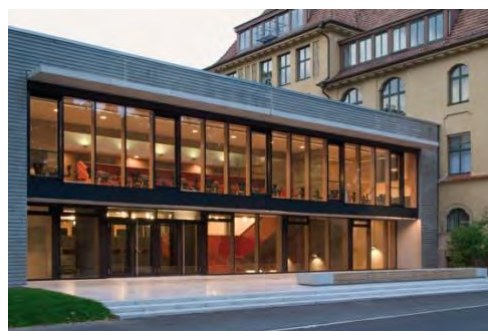
Die Mensa Uhlandstraße im Gebäude des Kepler-Gymnasiums

Nähere Informationen erhalten Sie auf unserer Internetseite .