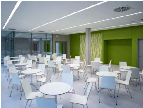
Die Cafeteria des Uhland-Gymnasiums bietet Platz zum Essen und Verweilen