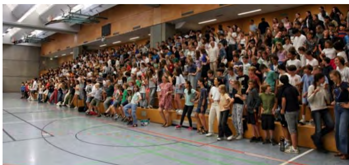
Jeder darf mitreden! Unsere Schulgemeinschaft bei der Schulversammlung im Schuljahr 2023/24

Darüber hinaus können sich die Schüler*innen in der Schüler*innen-mitverantwortung (SMV) oder im Schüler*innensanitätsdienst (siehe Informationen unter 3.4 und 3.5) einbringen.