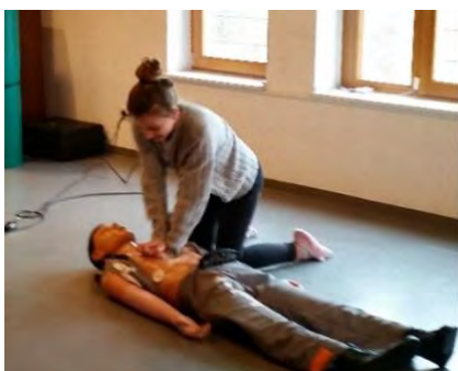
Erste Hilfe kann Leben retten! Schülerin beim Üben der Herzdruckmassage an einer Puppe

Seit 2005 werden am Uhland-Gymnasium Schüler*innen im Bereich Erste Hilfe ausgebildet.