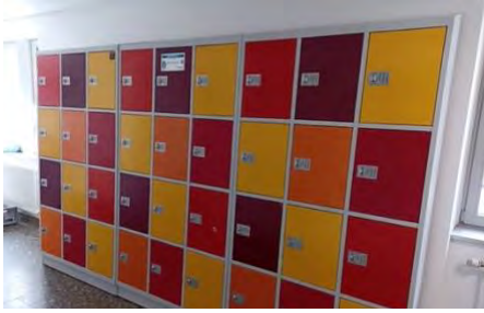
Schließfächer im Untergeschoss des Altbaus

Schließfächer im Untergeschoss des Altbaus sowie neben der Spielhalle im Erdgeschoss des Neubaus können über den Anbieter direkt gemietet werden. Die Anmeldung erfolgt über die Internetseite der Firma Astra . Nach der Anmeldung wird ein Schließfach-Code ausgestellt und zugesandt. Es kann gebucht werden, solange der Vorrat reicht.