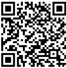
QR-Code zum Speiseplan der Mensa

Den Speiseplan können Sie über folgenden Link (klicken Sie auf „Mensa Tübingen Speisepläne“) oder QR-Code abrufen: